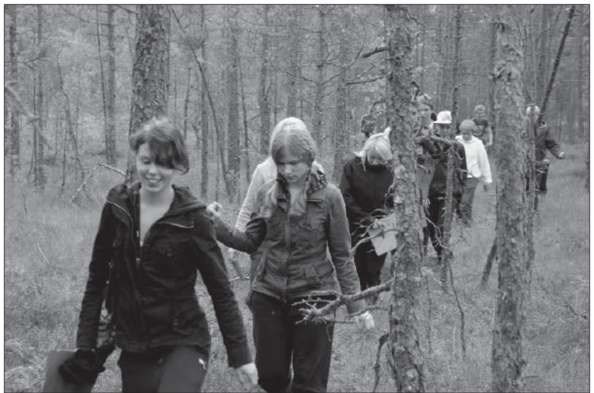
9:e klassen från Ljungarumsskolan på väg att sättas ut i Bottnaryds urskog. Att sitta ensam i skogen och bara finnas till är en stor upplevelse för elever i alla åldrar.