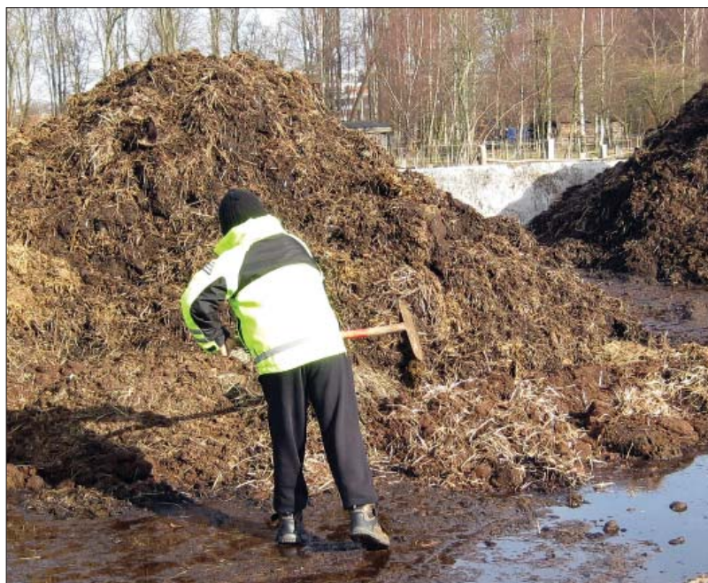
Isen smälter och lämnar jord efter sig jord.

när vi tar oss ut till odlingsytan. Jag frågar vad jord består av och hur den kommit hit. De flesta barnen svarar att jord är maskbajs. Här har skolan verkligen lyckats förmedla ett kretsloppstänkande. Jag kontrar med att det måste ha varit väldigt många maskar här. Eleverna klurar vidare och kommer med fler förslag. Kobajs! Vi har kanske köpt säckar med jord! Den kan ha blåst hit! Det finns sand i jorden! Gamla äppelskruttar kan bli jord! Det är ingen hejd på förslagen. När vi tittar i luppen hittar vi både sandkorn, stenar och växtrester. Vi kommer till slut också in på istiden och jag visar min hemmagjord istid som håller på att smälta bort. En ca två liter stor snömassa med