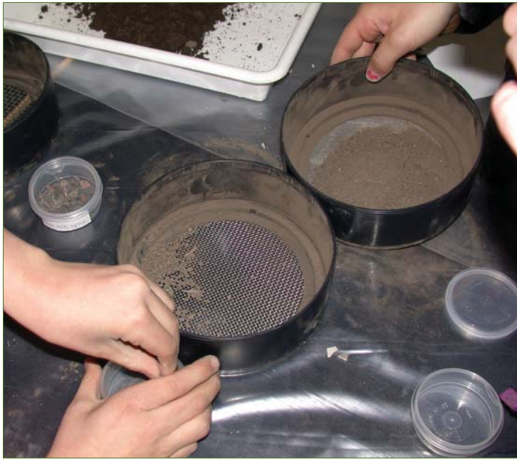
Är jorden sandig eller lerig?

sten och grus, som jag i förväg lagt ut på en träbricka med borrarade hål så att smältvattnet rinner bort. Vi pratar om att jorden måste gödslas innan de kommer nästa gång för att sätta sina potatisar och tar oss till komposterna som befinner sig i olika nedbrytningsstadier. På vägen letar vi maskbajs. Vi besöker sedan stallet där eleverna får mocka i hästarnas bås. Vi slänger bajset på gödselhögen utanför och tittar på gödselhögar i olika nedbrytningsstadier. Har vi tur kommer vår museibonde ut med arbetshästarna för att sprida gödsel.