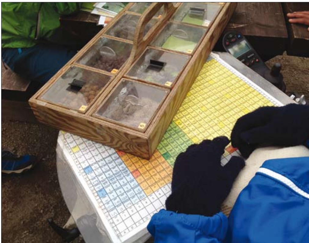
Naturskola är till för ALLA.