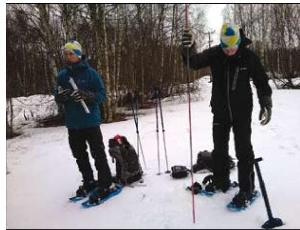
Lavinkunskap förebygger dödsolyckor - både i och utanför pisterna.

möjligheterna i vår roll som både förebilder och pedagoger. Folkhälsa i form av utökad rörelse och sunda kostvanor bland unga är ledord vi vill lyfta fram! Kan vi påverka vad eleverna stoppar i sig under en skoldag utomhus när vi till bättre fysisk och intellektuell närvaro. Kan vi tydligt visa hur klädvalet påverkar mäendet och prestationsförmågan i sammanhanget är mycket vunnet. Kan vi påverka genom att lyfta fram medvetenheten av att människan är en psykisk, fysisk och social varelse kan både en individ i en grupp samt gruppen kring individen fungera bättre. Är vi dessutom noggranna med att se till att naturen hålls ren omkring oss har vi en bättre framtid att se fram emot!