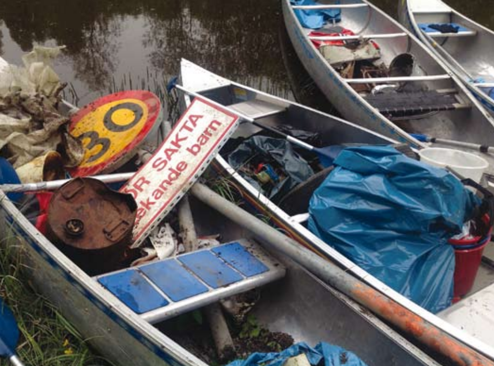
Skräpplockarpaddling i Selångersån.