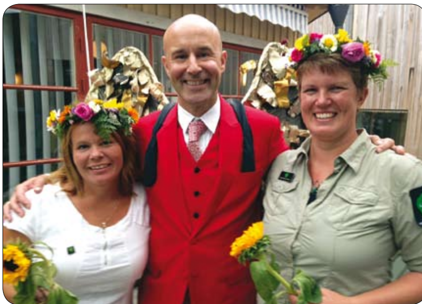
Med blommor i håret och under ÄnglaMarks vingars beskydd!

V ilken kanonstart på hösten! Hela augusti har bara strålat av solsken, och uppmärksamhet! Änglamarkspriset! - blev inte vårt, men att vara en av tre finalister av 124 nominerade! Ja, jag är lycklig in i själen, fortfarande. När jag i juni fick veta att vi var finalist så kände jag en pirrande glädje i hela kroppen och den höll i sig hela sommaren och gick så småningom över i viss nervositet när dagen närmade sig.