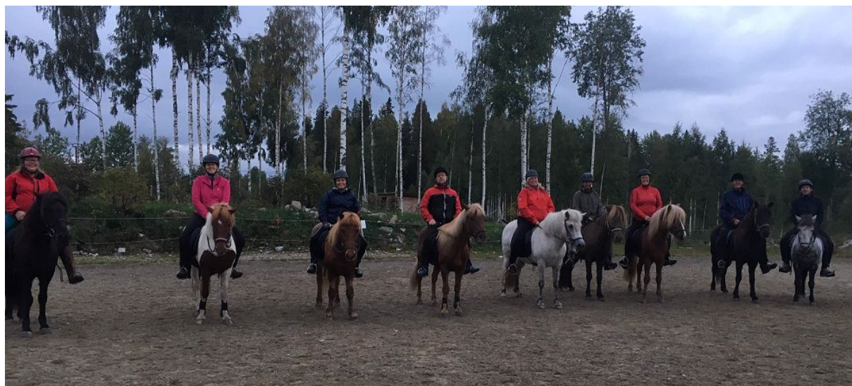
Styrelsen 2018 (Hassela)