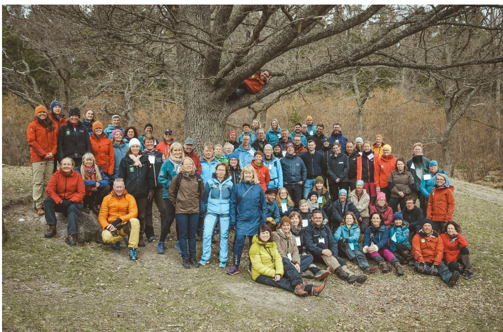
Årsmöteskonferens 2018