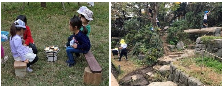
Besök på spännande utomhusmiljöer i Japan, november 2018

Circular Play Systems, en modell skapad av professor Mitsuru Senda med olika element som främjar och triggat barnens impuls att leka, stod också på programmet samt hur man i Japan ser på kalkylerat risktagande och barns rätt till att själva utforska och öva i sin närmiljö. De efterföljande ledarskapsdagarna hade bland annat fokus på skol- och förskolegårdars roll och funktion i samband med den globala klimatförändringen samt hur man på olika sätt kan knyta samman dessa miljöer med det övriga närsamhället och omvärlden.